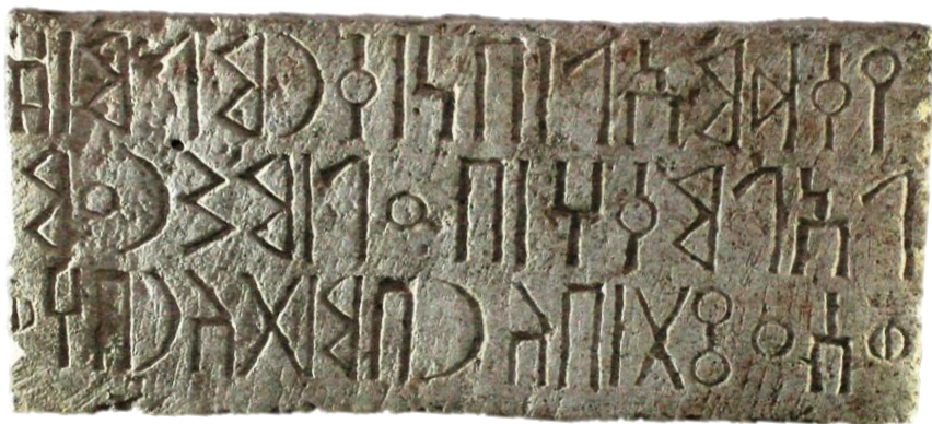
لوحة ٤: النقش (٤م.س/ الشرعي الجوف، ٤)