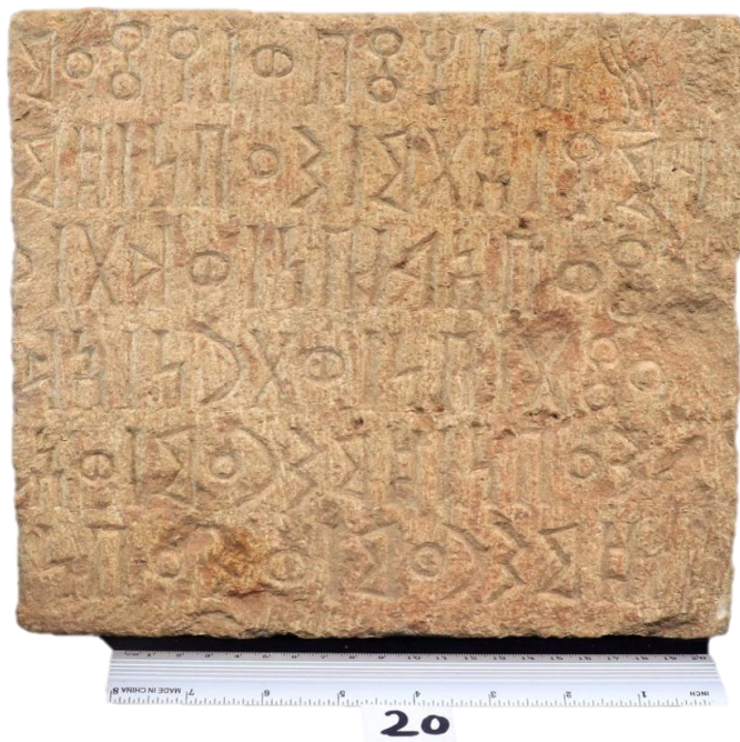
لوحة ١: النقش (٢٠ م.س/ الشرعي الجوف، ١)