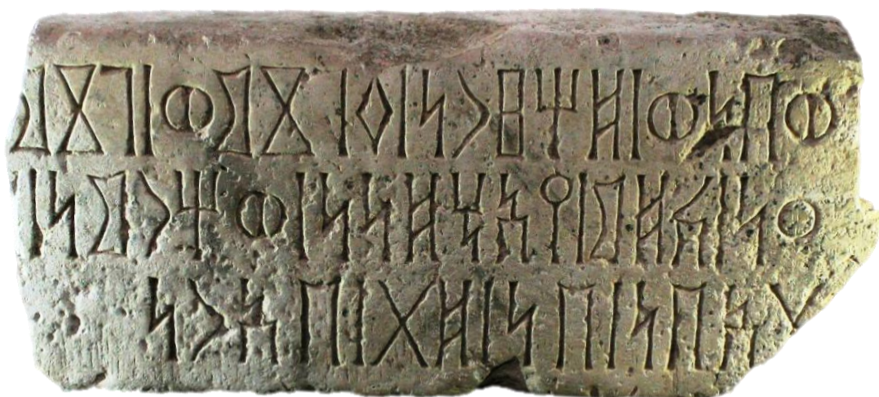
لوحة ٥: النقش (٥م.س/ الشرعي الجوف، ٥)